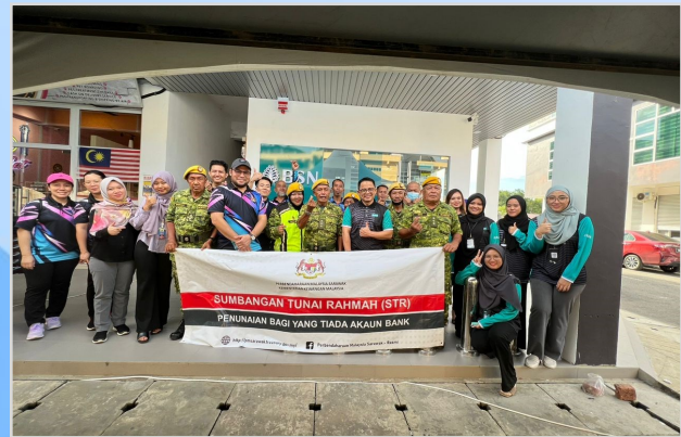
22 Ogos 2023 - Program Penunai Sumbangan Tunai Rahmah (STR) di BSN Cawangan Lawas.