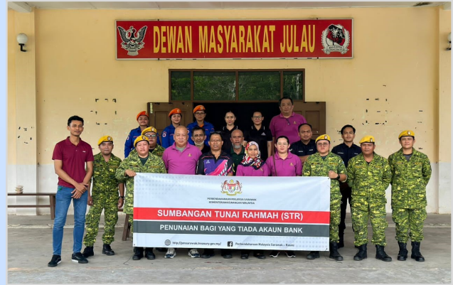
8 Ogos 2023 - Program Penunaian Sumbangan Tunai Rahmah (STR) di Dewan Masyarakat Julau.