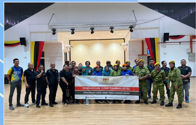
14 Ogos 2023 - Program Penunaiian Sumbangan Tunai Rahmah (STR) di Dewan Masyarakat Daro.