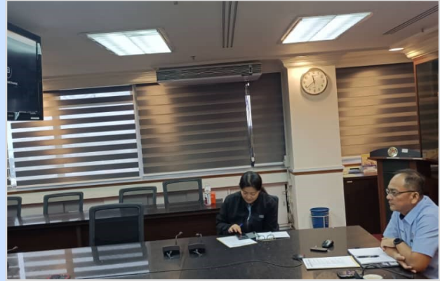
23 Ogos 2023 - Mesyuarat Membincangkan Minit Mesyuarat Jawatankuasa Teknikal Di Bawah MTPMA63 Bil.1 / 2023.