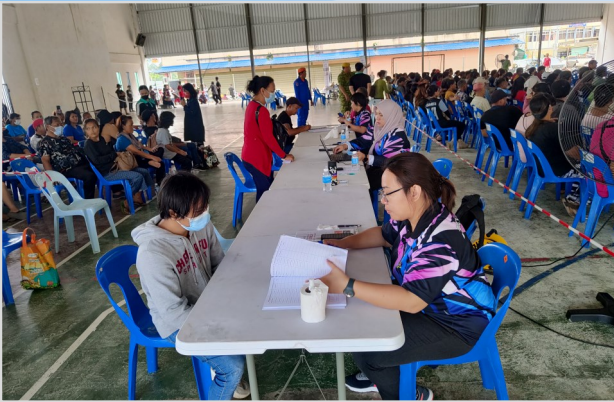
12 Ogos 2023 - Program Penunaiian Sumbangan Tunai Rahmah (STR) di Dewan SJKC Kee Tee, Long Lama (Hari Pertama)..