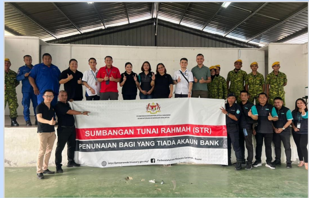
14 Ogos 2023 - Program Penunai Sumbangan Tunai Rahmah (STR) di Dewan Masyarakat Kalok, Pusa.