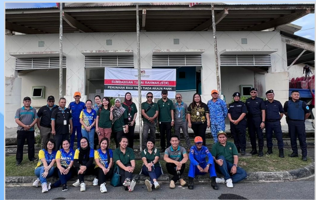
9 Ogos 2023 - Program Penunaian Sumbangan Tunai Rahmah (STR) di Dewan Sukan Tatau.