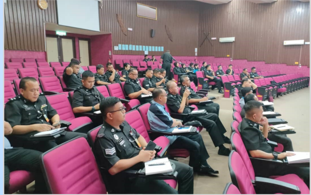
1 hingga 3 Ogos 2023 - Kursus Tatacara Pengurusan Aset Alih Kerajaan Jabatan Penjara Malaysia.