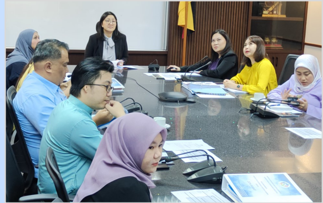
25 Ogos 2023 - Mesyuarat Jawatankuasa Induk EKSA Bil. 2 / 2023.