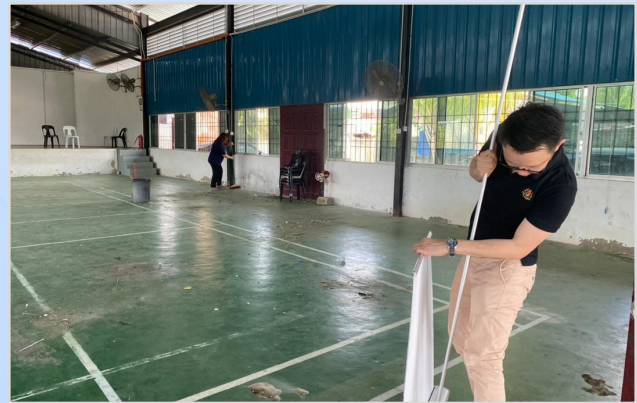
13 Ogos 2023 - Persiapan Program Penunai Sumbangan Tunai Rahmah (STR) di Dewan Masyarakat Kalok, Pusa.