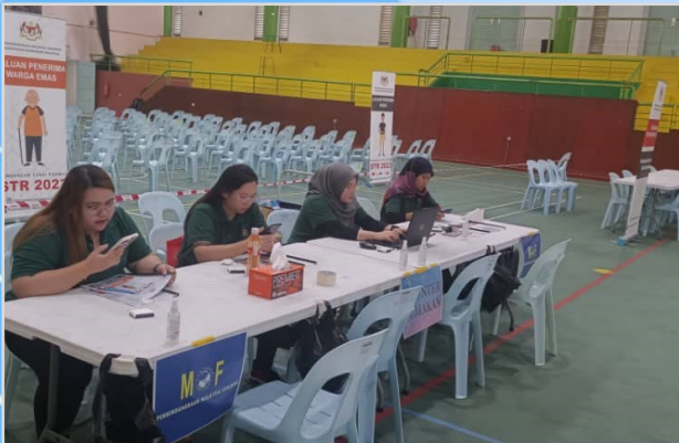
12 Ogos 2023 - Program Penunaiian Sumbangan Tunai Rahmah (STR) di Dalam.