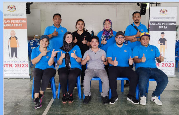
13 Ogos 2023 - Program Penunai Sumbangan Tunai Rahmah (STR) di Dewan SJKC Kee Tee, Long Lama (Hari Kedua).