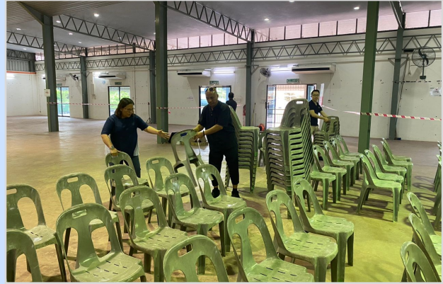
11 Ogos 2023 - Persiapan Program Penunai Sumbangan Tunai Rahmah (STR) di Dewan Masyarakat Spaoh.