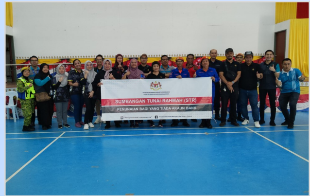
17 Ogos 2023 - Program Penunai Sumbangan Tunai Rahmah (STR) di Dewan Masyarakat Beluru.