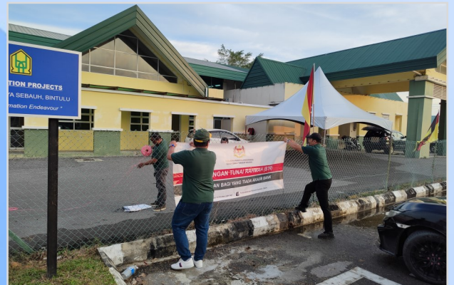
9 Ogos 2023 - Persiapan Program Penunaian Sumbangan Tunai Rahmah (STR) di Balai Raya Sebauh.