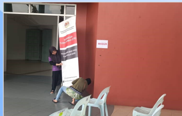
11 Ogos 2023 - Persiapan Program Penunai Sumbangan Tunai Rahmah (STR) di Dalat.