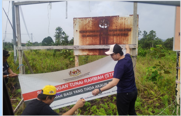
21 Ogos 2023 - Persiapan Program Penunai Sumbangan Tunai Rahmah (STR) di Dewan Masyarakat Sungai Asap.