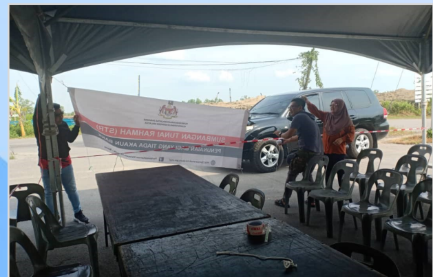
14 Ogos 2023 - Persiapan Program Sumbangan Tunai Rahmah (STR) di Pusat Penjaja Kabong.