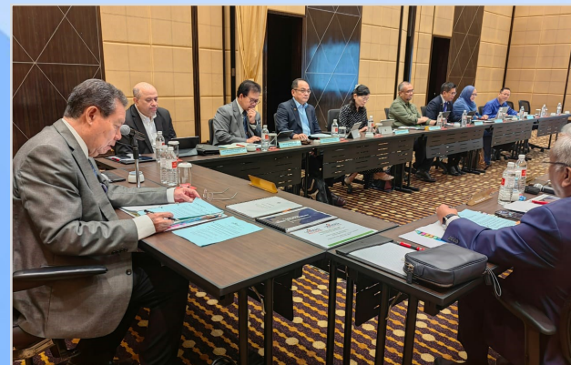
26 Ogos 2023 - Perbincangan bersama UHSB Management Committee dan Mesyuarat Lembaga Pengarah Universiti Bil.4-2023 (UNIMAS) di Grand Millennium Hotel Kuala Lumpur.