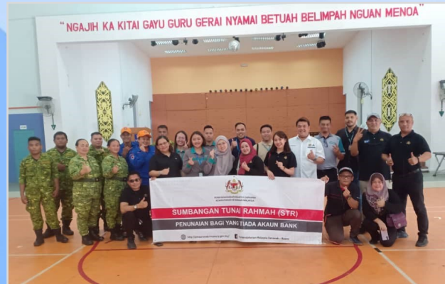
5 Ogos 2023 - Program Penunaian Sumbangan Tunai Rahmah (STR) di Dewan Sukan Lubok Antu.