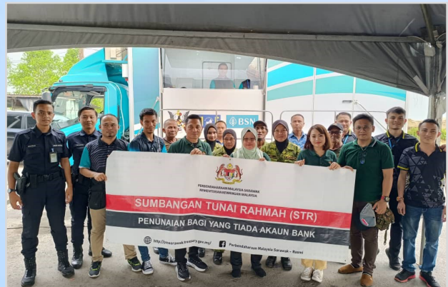
15 Ogos 2023 - Program penunaian Sumbangan Tunai Rahmah (STR) di Pusat Penjaja Kabong.