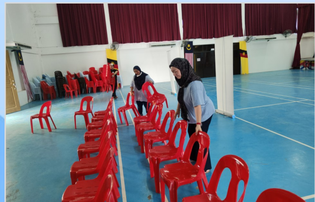
16 Ogos 2023 - Persiapan Program Penunaian Sumbangan Tunai Rahmah (STR) di Dewan Masyarakat Beluru.