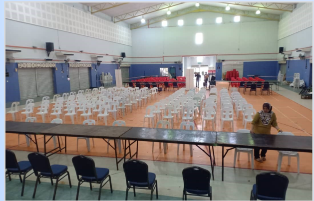
4 Ogos 2023 - Persiapan Program Penunaian Sumbangan Tunai Rahmah (STR) di Dewan Sukan Lubok Antu.