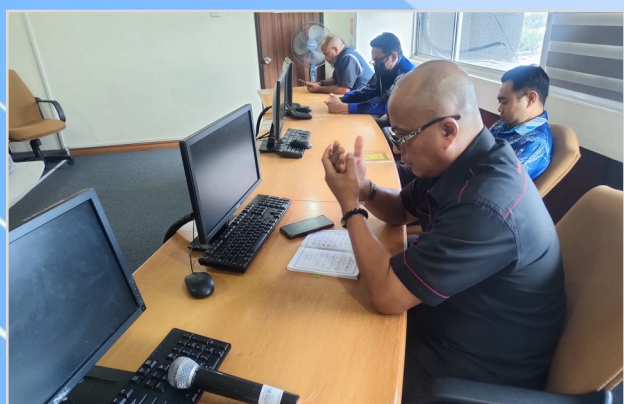
3 Ogos 2023 - Program Bacaan Yassin anjuran Biro Kerohanian Kelab PMSarawak.