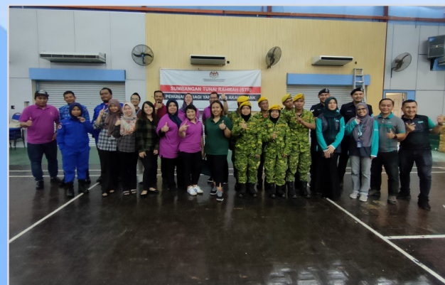
15 Ogos 2023 - Program Penunai Sumbangan Tunai Rahmah (STR) di Dewan Masyarakat Bekenu.