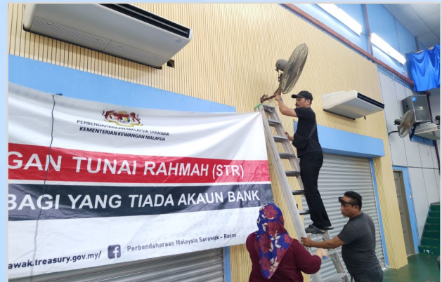
14 Ogos 2023 - Persiapan Program Penunaiian Sumbangan Tunai Rahmah (STR) di Dewan Masyarakat Bekenu.