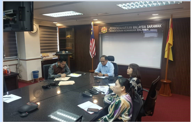
17 Ogos 2023 - Mesyuarat Pelaksanaan Program Penunai Sumbangan Tunai Rahmah (Pedalaman) bersama MoF, PMSarawak, PMSabah, BSN dan Pos Malaysia.