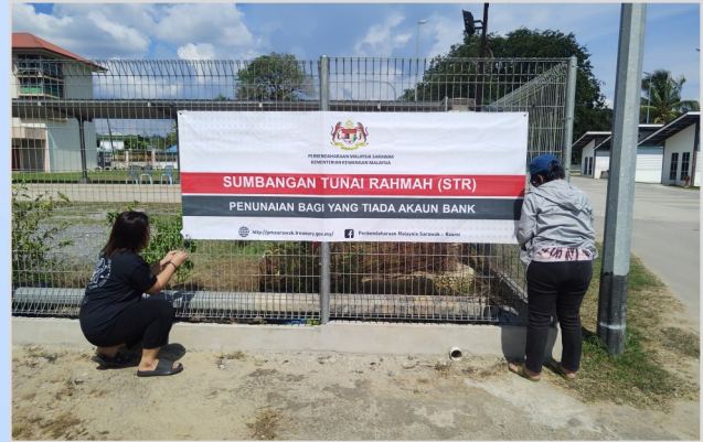
11 Ogos 2023 - Persiapan Program Penunai Sumbangan Tunai Rahmah (STR) di Dewan SJKC Kee Tee, Long Lama.