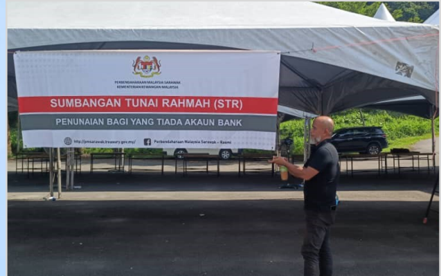
9 Ogos 2023 - Persiapan Program Penunaian Sumbangan Tunai Rahmah (STR) di Laman Pakan.