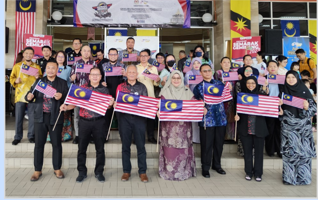
3 Ogos 2023 - Flag Off Kembara Merdeka Program Semarak Gemilang 2023.