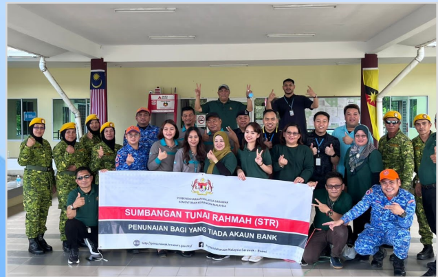
7 Ogos 2023 - Program Penunai Sumbangan Tunai Rahmah (STR) di Pejabat Daerah Lingga.