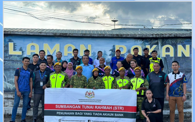
10 Ogos 2023 - Program Penunaian Sumbangan Tunai Rahmah (STR) di Laman Pakan.