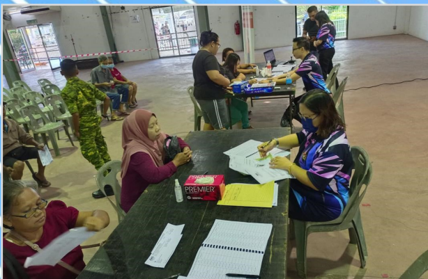
12 Ogos 2023 - Program Penunaiian Sumbangan Tunai Rahmah (STR) di Dewan Masyarakat Spaoh.