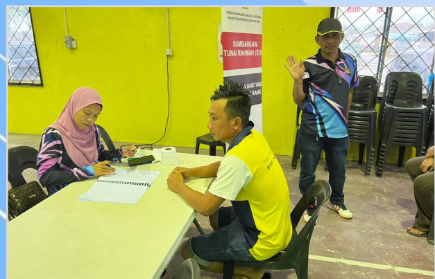
16 Ogos 2023 - Program Penunaian Sumbangan Tunai Rahmah (STR) di Dewan Serbaguna Matu.