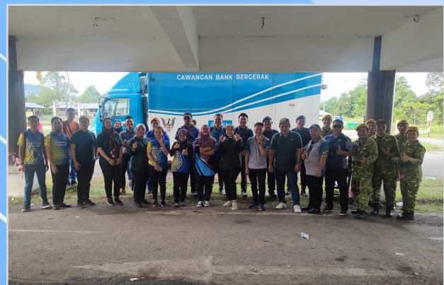
22 Ogos 2023 - Program Penunai Sumbangan Tunai Rahmah (STR) di Dewan Masyarakat Sungai Asap.