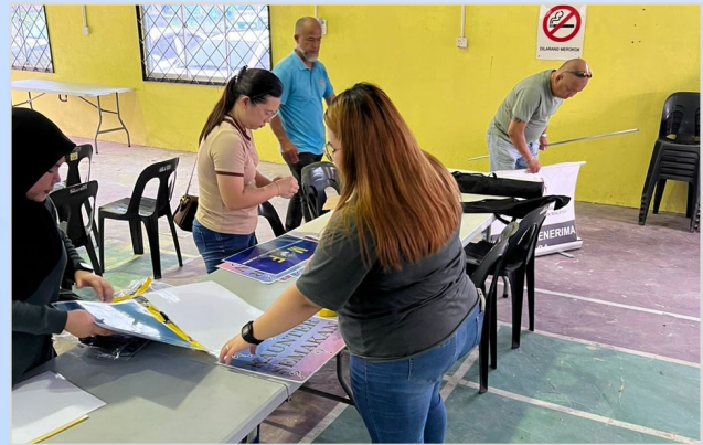
15 Ogos 2023 - Persiapan Program Penunai Sumbangan Tunai Rahmah (STR) di Dewan Serbaguna Matu.