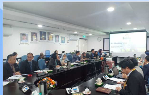
21 Ogos 2023 - Mesyuarat Membincangkan Cadangan Iniatif Belanjawan 2024 di Unit Perancang Ekonomi Sarawak, Jabatan Premier Sarawak