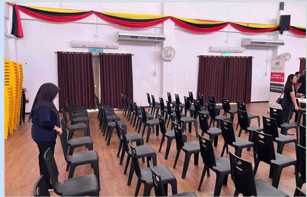
13 Ogos 2023 - Persiapan Program Penunai Sumbangan Tunai Rahmah (STR) di Dewan Masyarakat Daro.