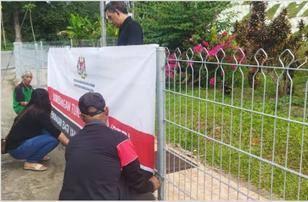
7 Ogos 2023 - Persiapan Program Penunai Sumbangan Tunai Rahmah (STR) di Dewan Masyarakat Julau.