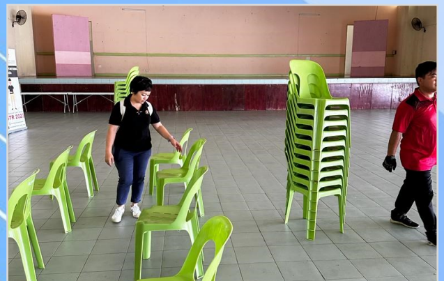
8 Ogos 2023 - Persiapan Program Penunai Sumbangan Tunai Rahmah (STR) di Dewan Sukan Tatau.